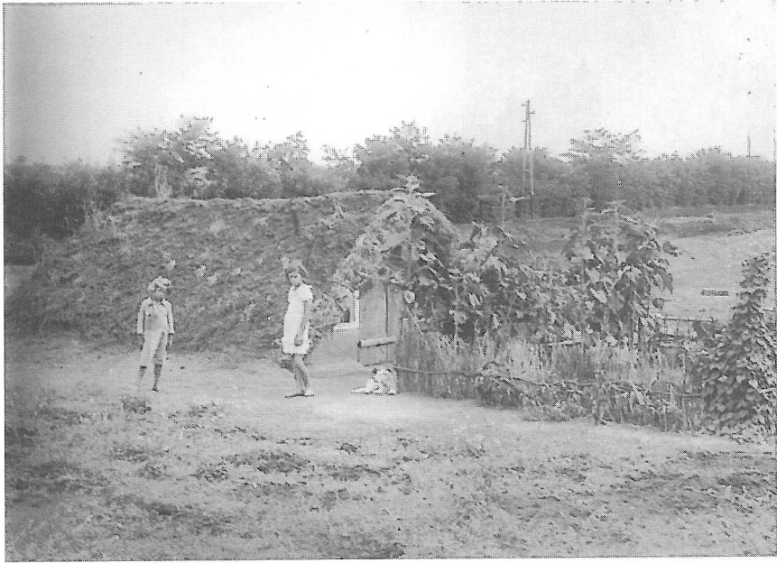
Derzstomaj, dinnyés kunyhó. 1939, Táj-és Népkutató tábor, Vargyas Lajos felvétele. Ld. bibliográfia: Kerítésen kívül. Emlékek életemből. (1993)