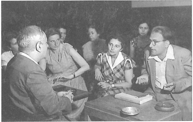
A bukaresti Folklor Intézetben, 1954. Ld. bibliográfia: „Tapsztalataim a román népdalgyűjtésről” (1954) és „Beszámoló a romániai néprajzi kutatásról” (1955).