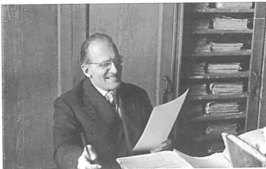
Néprajzi Múzeumbeli irodájában, 1965