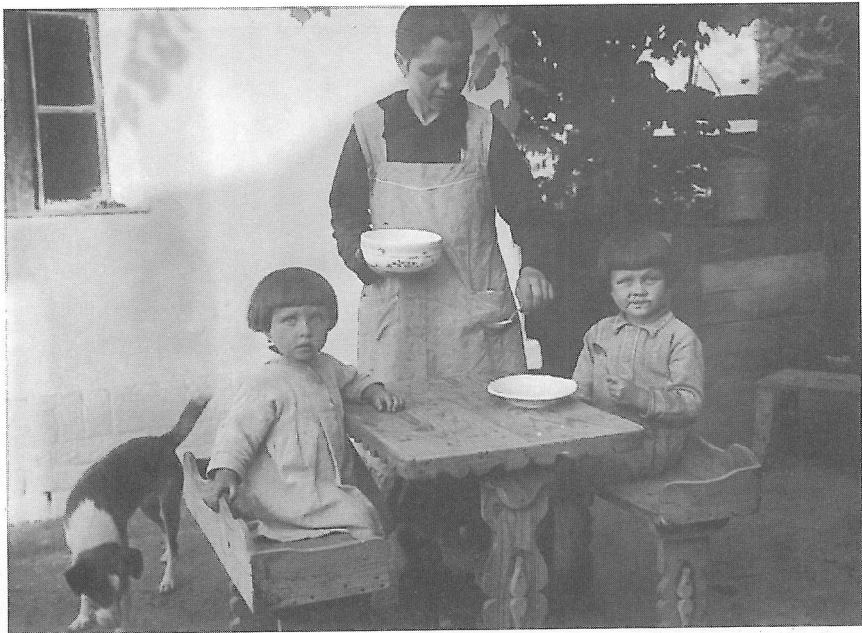
Kiskunhalas. 1939, Táj-és Népkutató tábor. Ld. bibliográfia: Régi népdalok Kiskunhalasról (1954) és Kerítésen kívül. Emlékek életemből. (1993)