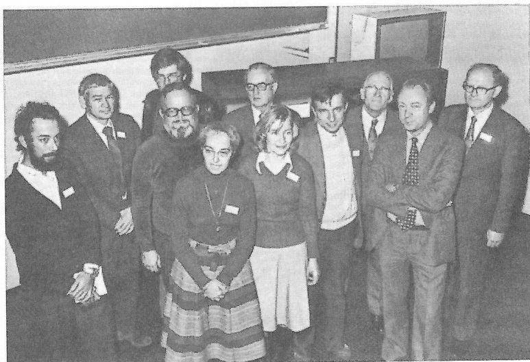
Az Odense Universitet (Dánia) Középkori Irodalmi Tanszéke (Laboratorium for Folkesproglig Middelalderliteratur) által szervezett ballada szimpóziium résztvevőivel. 1977 november 21-23. Ld.: Bibliográfia „Trends of Dissemination of the Ballad Genre” 1978